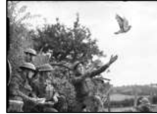
புறாக்கள் மூலம் தூதனுப்பல்