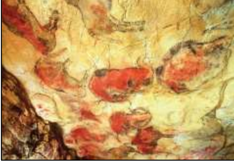
அல்ரா மீரா குகைச் சித்திரம்

மனிதனின் ஞாபக சக்தி அதிகரிக்க, ஞாபக மூட்டல் ஏற்பட்டது. தாம் வாழ்ந்த குகைச் சுவர்களில் இயற்கை வண்ணங்களைக் கொண்டு சித்திரங்கள் வரைந்து தொடர்பாடலைக் காட்டினர்.