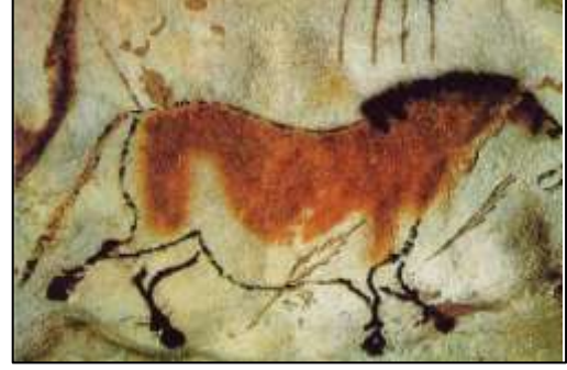
லெஸ்கோ குகைச் சித்திரம்

பின்னர் நடித்தும், சைகைகள் மூலமும் தொடர்பாடலைக் காட்டினர். அதன் பின்னர் வித்தியாசமான செயல்களுக்கு வித்தியாசமான குரல்களை எழுப்பப் பழகினான் இது மொழி உருவாக்கத்திற்கு முன்னோடியாக இருந்தது.